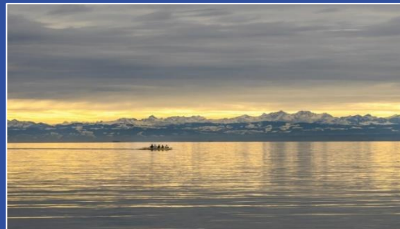
Ausblick vom Seecampus

Die ZU verkörpert den Pioniergeist ihres Namensgebers Ferdinand Graf von Zeppelin und bildet damit ein hervorragendes Umfeld für die Abstimmung eines PCG-Musterkodex. Der Veranstaltungsort soll dazu beitragen, die Friedrichshafener Maxime „Seeblick mit Weitsicht“ bei der Mitgestaltung der Zukunft zur Entfaltung zu bringen. Die Veranstaltung verspricht einen besonderen Erfahrungsaustausch und Best-Practice-Dialog zwischen Expertinnen und Experten aus dem Bereich der Public Corporate Governance.