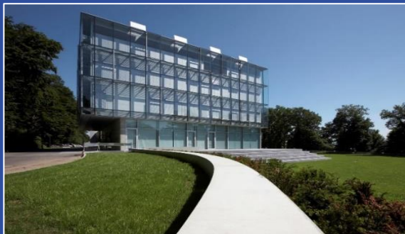
Veranstaltungsort: Seecampus der ZU

Die Kernergebnisse der Konsultationsbefragung im Rahmen der Entwicklung eines Public Corporate Governance Musterkodex (PCG-Musterkodex) sollen im Rahmen des ersten ZU|kunftssalon PCG-Musterkodex in einen PCG-Musterkodex überführt werden. Ziel soll die Abstimmung eines PCG-Musterkodex sein. Weiter wird eine Expertenkommission PCG-Musterkodex gebildet.