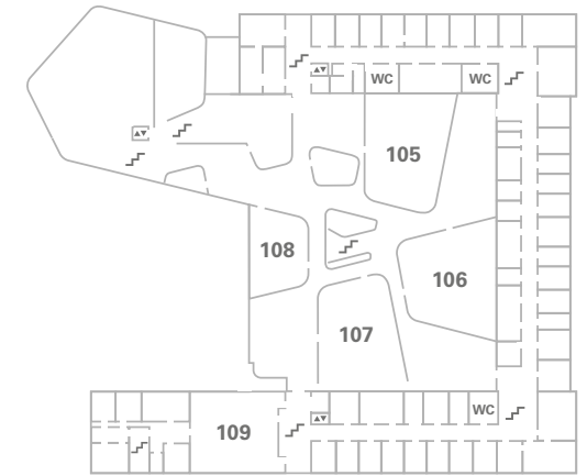
ZF Campus der ZU | 1. OG