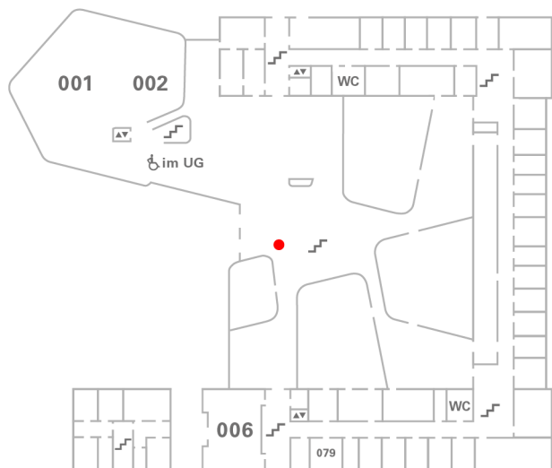
ZF Campus der ZU | EG