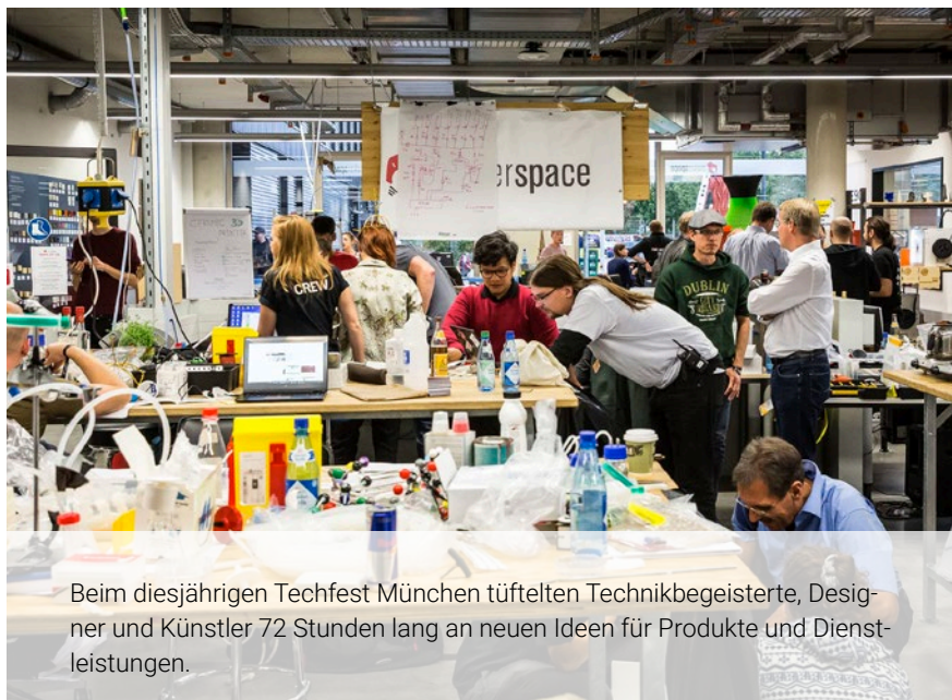
Beim diesjährigen Techfest München tüftelten Technikbegeisterte, Designer und Künstler 72 Stunden lang an neuen Ideen für Produkte und Dienstleistungen.