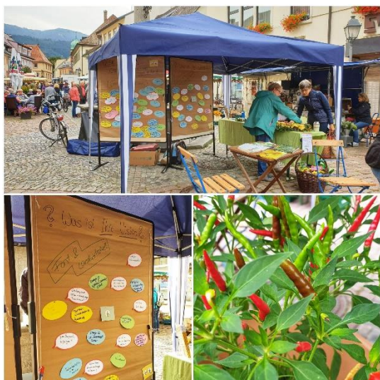
Aktion auf dem Waldkircher Wochenmarkt im Rahmen des Klimaschutzkonzeptes

Ernährung, Forst- und Landwirtschaft“ gab es deshalb ein besonderes Beteiligungskonzept. Vor der eigentlichen öffentlichen Veranstaltung Mitte September, fand zusammen mit der Bürgerinitiative Essbare Stadt eine Mitmachaktion auf dem Waldkircher Wochenmarkt statt. Dadurch sollten unter anderem die Menschen erreicht werden, die sonst weniger an klassischen Beteiligungsformaten teilnehmen, gleichzeitig aber mit dem Besuch des Wochenmarktes eine gewisse Interesse für regionale Lebensmittel und bewusste Ernährung zeigen. Auch der 2. Zukunftsmarkt 's Fairle wurde - wie innerhalb von KERNiG vorgeschlagen - als Plattform für einen Informationsaustausch genutzt. Auf diese Weise wurden zahlreiche neue Ansatzpunkte und Ideen gesammelt.