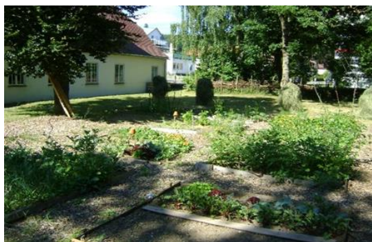
Mitmachgarten der „Bürgerinitiative KERNiG“ in Leutkirch im Allgäu

Gastronomie entstehen und welche Möglichkeiten existieren, um ein Wegwerfen von Lebensmitteln zu verhindern. Ein besonderer Schwerpunkt ist außerdem auf die Frage angemessener Portionsgrößen gelegt worden. Neben dem Sektor der Außer-Haus-Verpflegung hat das Teilprojekt auch Ernährungsinitiativen in den Blick genommen, in denen gemeinsame Aktivitäten des Gärtnerns, Kochens und Essens im Mittelpunkt stehen. Hierbei wurden charakteristische Unterschiede der Initiative systematisch untersucht, z.B. im Hinblick auf Entwicklungsgeschichte, organisatorischen Aufbau sowie Prozesse der Vergemeinschaftung.