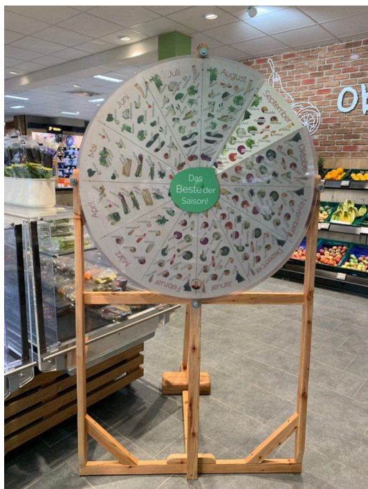
Das Saisonrad im Edeka in Kollnau

letzten Newsletter vorgestellt wurde (01/2019). Es kann in Supermärkten aufgestellt werden und erreicht so eine Vielzahl an Menschen aus unterschiedlichen Milieus. Durch Drehen wird der Abschnitt sichtbar, auf dem das Obst und Gemüse abgebildet ist, das gerade vor Ort verfügbar ist.