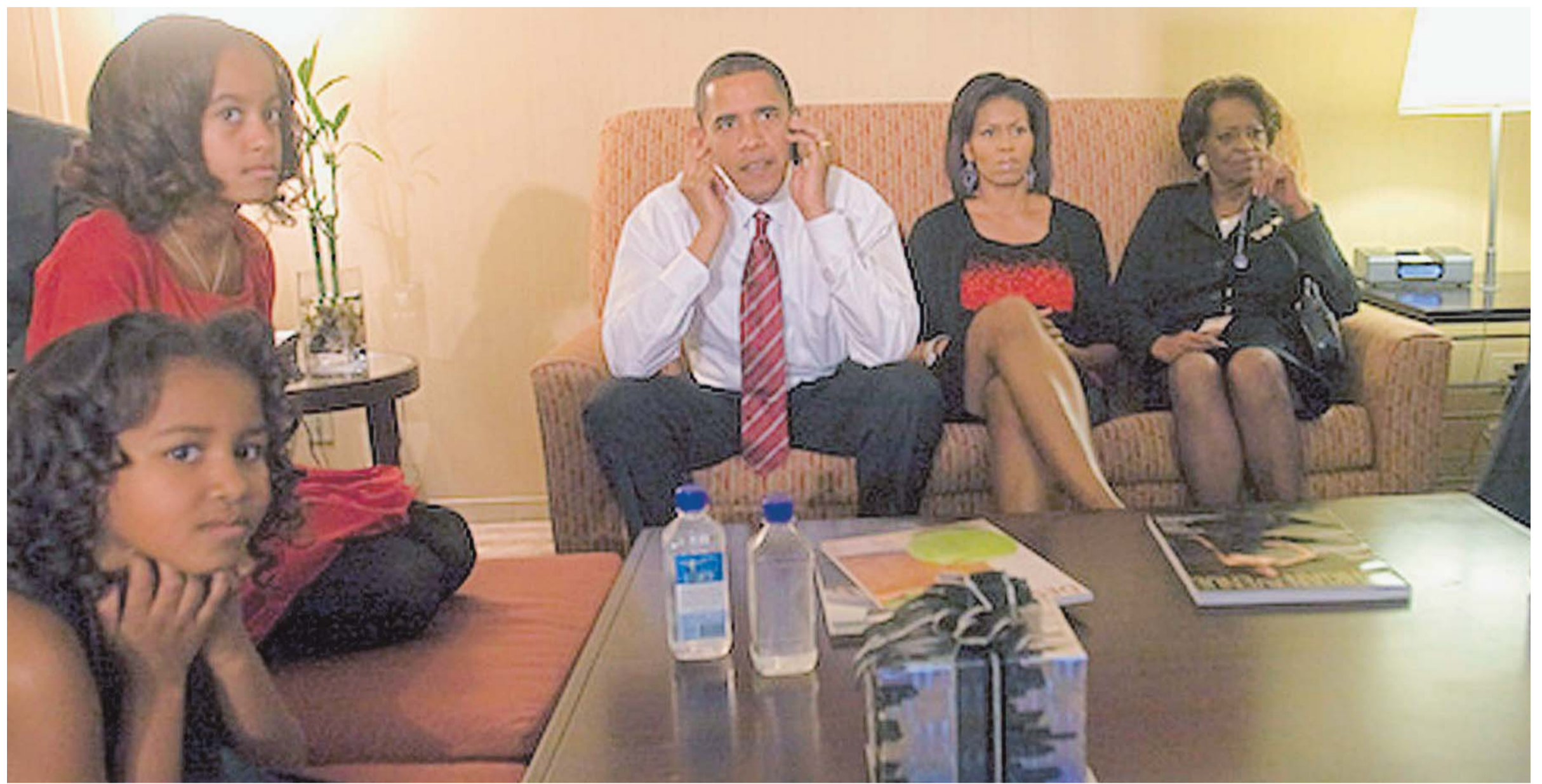
Warten auf den Wahlsieg: Familie Obama am Abend des 4. November in Chicago; neben dem Noch-Kandidaten seine Frau und seine Schwiegermutter; vorne die Töchter Sasha und Malia (knieend)

Charisma jedoch ist eine Stärke, die nie an spezifische Inhalte gebunden ist. Bill Clinton zum Bei-