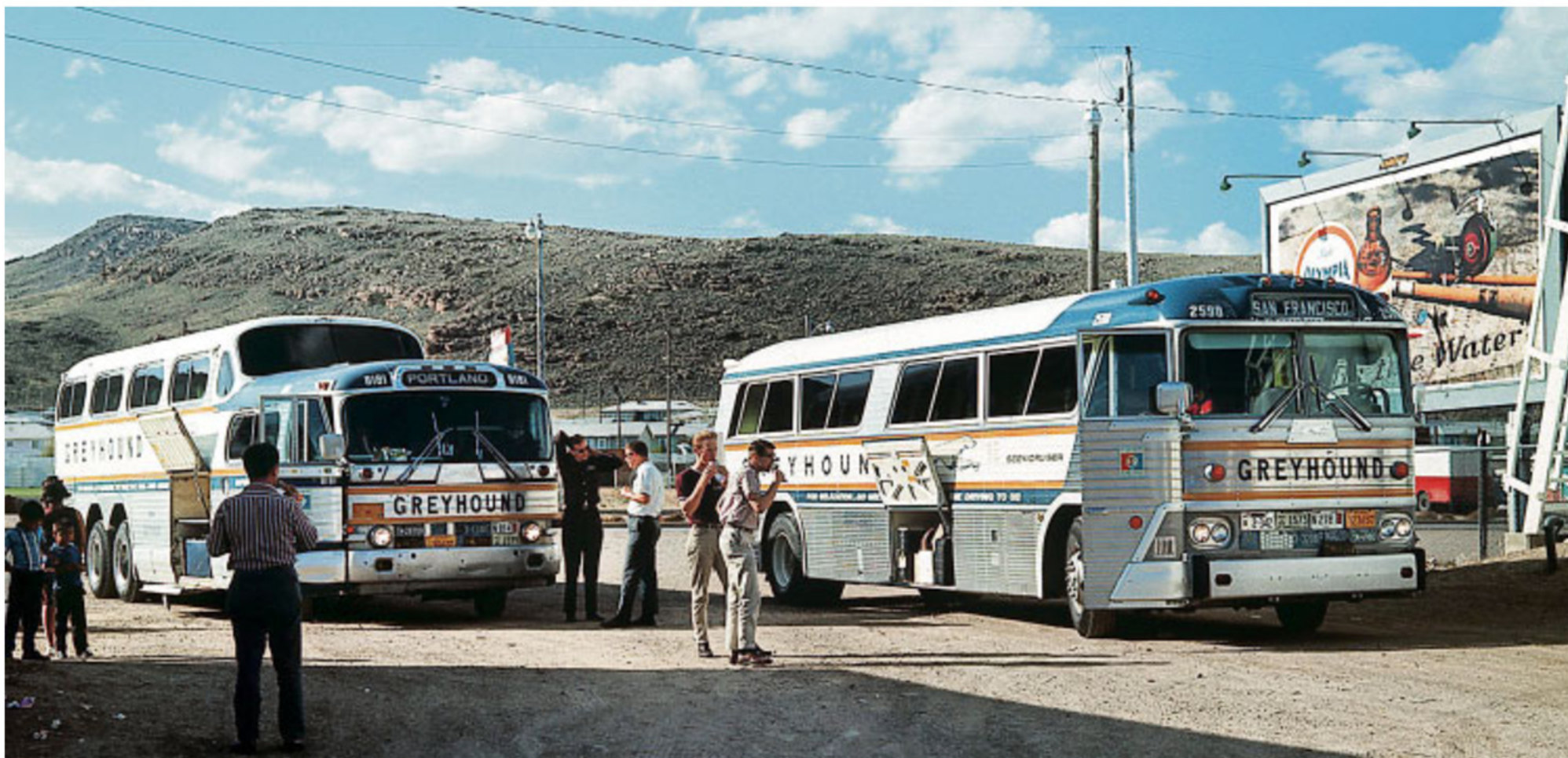
Greyhounds, die amerikanischen Fernbusse, sind das Vorbild.

Nur im internationalen Verkehr konnte der Staat der Bahn keinen Heimatschutz bieten. Daher kann man mit der Deutschen Touring, die spanischen und portugiesischen Busunternehmen gehört, von 80 deutschen Städten in etliche europäische Länder fahren. Im Inland ist das Streckennetz