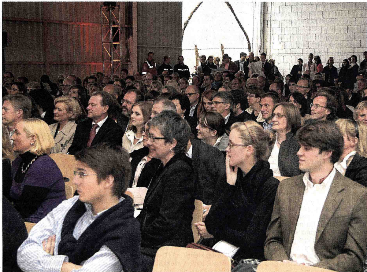
„Großer Bahnhof“ in der Bootshalle: Rund 1200 Gäste hatten sich zum fünften Sommerfest der Zeppelin Universität angemeldet.