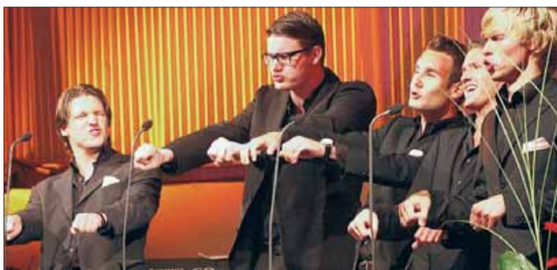
... Studierende und Ehemalige auf die Bühne im Fallenbrunnen, wo bis tief in die Nacht gefeiert wird.

sität komplett den Studierenden in Form von Voll-Stipendien zu übergeben, und der zahlreichen visionären Ausblicke auf den Fallenbrunnen, ist es die Ankündigung Jansens, sich ab Frühjahr 2009 „Zeppelin Universität“