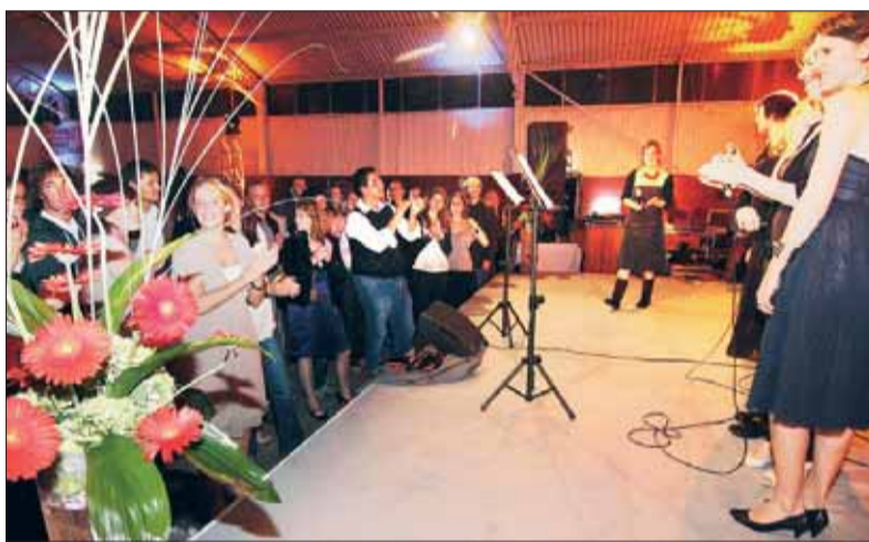
Unterhaltung, Show, Musik und das Talent, sich feiern zu können, bringt...

Neben der Ankündigung, die vom Land zugesagten Mittel für die Univer-